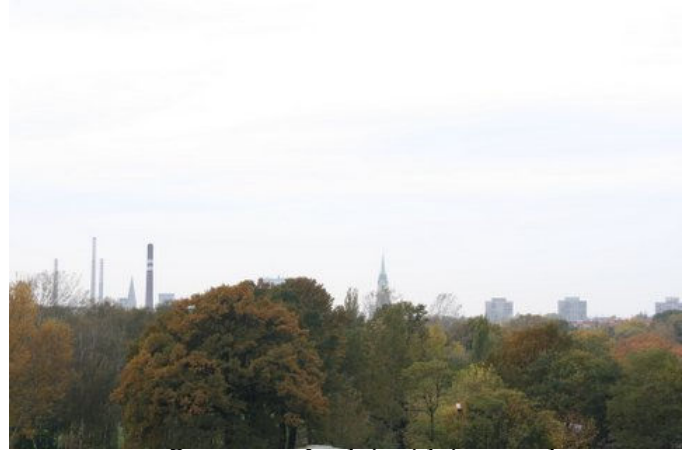
Panorama Łodzi widziana z okna