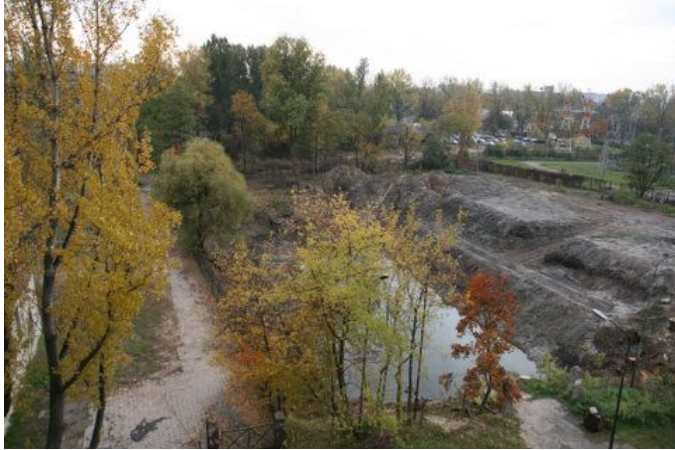
Oczyszczane jeziorko wewnątrz osiedla